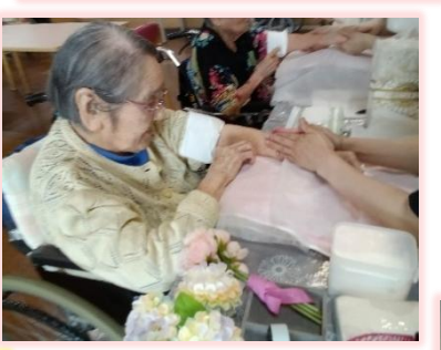
美容の日 ♡癒しの時間♡