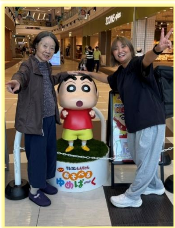
～ショッピングモール～ ランチや買い物、カフェを 楽しんできましたよ♪