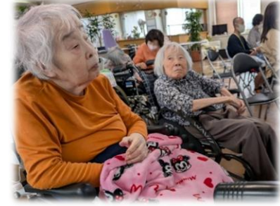
ソフラ/コンサート 素敵な歌声に大満足♪